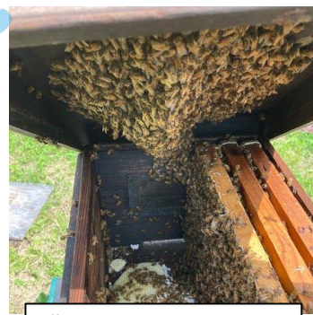
農場のミツバチたち