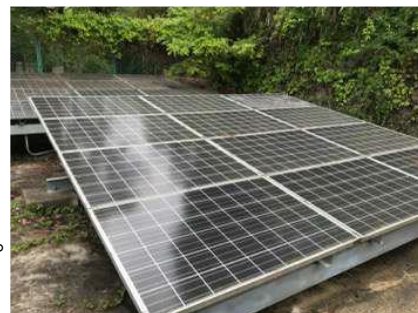
旧東中学校にあったパネルを再利用して能勢分校に移設

そして9月30日(金)、いよいよ分校に太陽光発電パネルを設置します。この発電パネルでE-bikeのバッテリー充電を行います。また、電力の見える化による電力使用の意識啓発も見込んでいます。能勢町のゼロカーボントウン推進を高校生の視点で考え進めています。