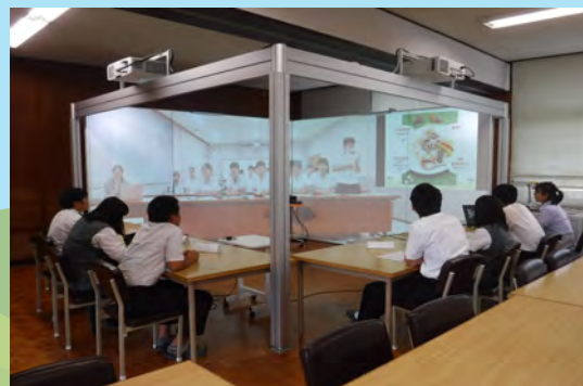
▶本校とのオンライン授業

2年次からは自由選択科目の授業があって、自分で好きな授業をカスタマイズできるよ！