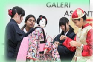
姉妹校(マレーシア アスンタ高校)にて