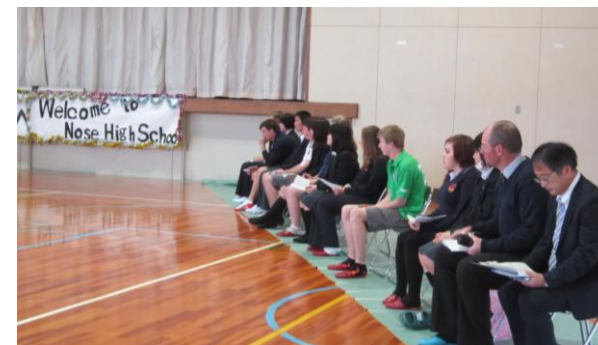
ウェルカムセレモニー (体育館)

日本滞在最終日となる22日(火)は、朝8時に本校に集合しバスで出発しました。伊丹空港から、空路成田を経由して、オーストラリアへ帰国しました。能勢町滞在4日、本校での交流は1日という短い時間でしたが、内容の濃い有意義なものになりました。