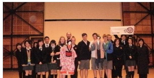
人形浄るり体験 (浄るりシアター)