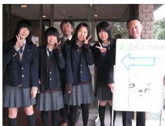
—ユネスコセミナーで発表—

能勢高校は、平成22年7月に大阪府では7番目の学校としてユネスコスクールに認定されました。