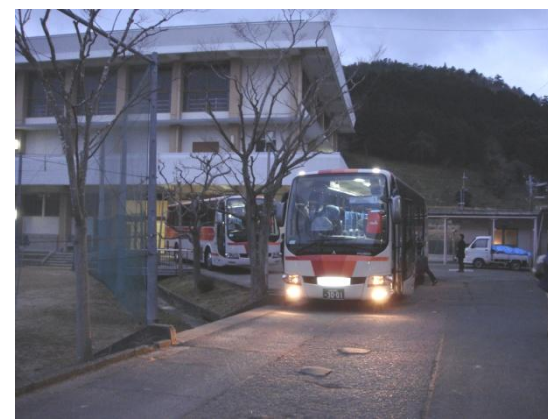
1月16日（月）外気温4℃の能勢高校から元気よく関西国際空港に向け早朝7時に出発しました。