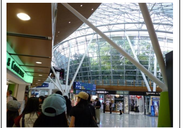
クアラルンプール空港到着。巨大なショッピングセンターを備えた、大きく立派な空港でした。