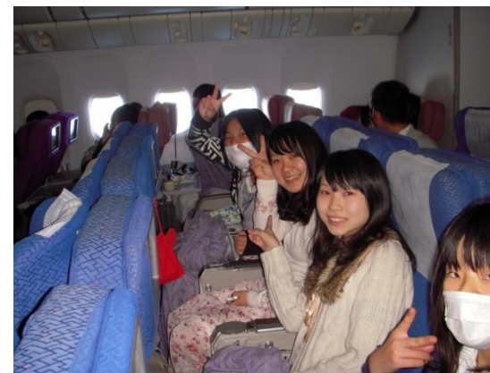
約7時間のフライトでした。マレーシアへ向けてGo！