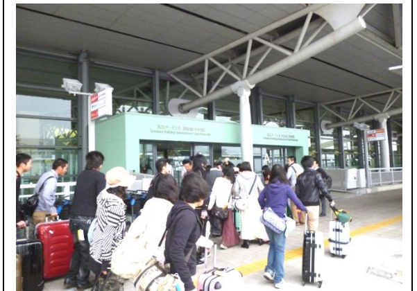
9時に関西国際空港到着。マレーシアは暑いので防寒着は能勢高校へ置いてきました。バスを降り少しだけ外を歩くと、寒かった！