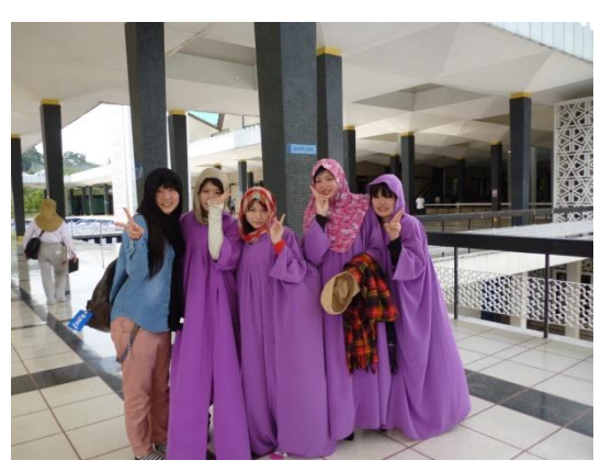
国立回教寺院です。女子は肌を見せてはいけません。祈る場所は信者しか入れない神聖なところでした。