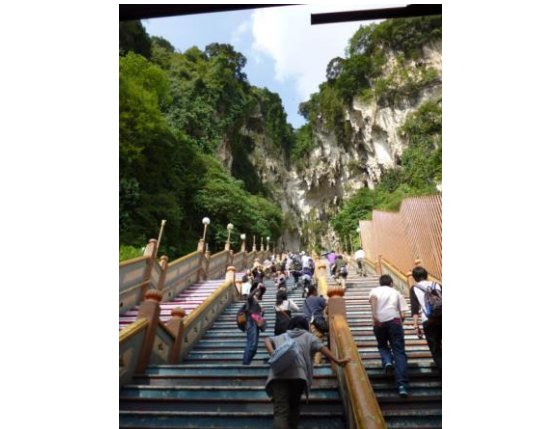
ヒンズー教のバツ洞窟です。一神教の世界から、多神教の世界へ。272段の急な階段を登って行きます。

次の日、クアラルンプールからマレーシアの政府機関が集まっている美しい人工都市のプトラジャヤを経由して、古くから交易の拠点であるマラッカを観光した後、クアラルンプール空港から帰国しました。