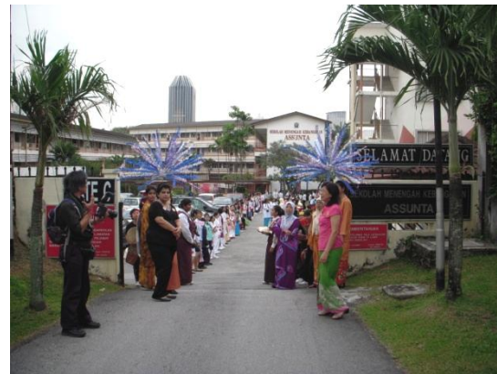
アスンタ高校との交流です。門をくぐってすぐに盛大な歓迎を受けました。「こんにちは」と日本語で挨拶してくれました。