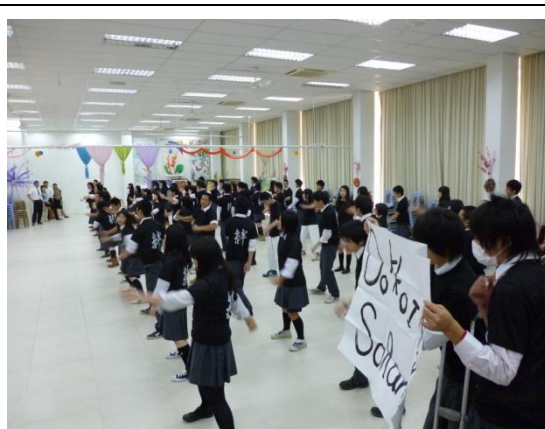
さあ、いよいよ「南中ソーラン」の披露です。揃いの「絆Tシャツ」を着て、気合を入れて踊ります。