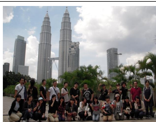
クアラルンプールで代表的な建物のツインタワーを背景に記念撮影です。