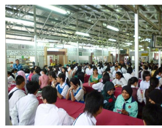
早速交流班のメンバー顔合わせです。どうぞよろしくお願います。ちなみにアスンタ高校は女子高です。