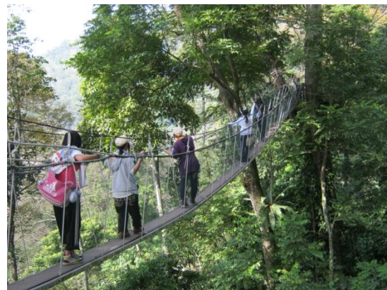
キャノピーウォークです。スリル満点の吊り橋。安全のため3mおきに進みます。薄そうな板の橋で、幅が狭く揺れる！