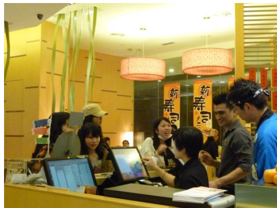
昼食はクアラルンプール市内の繁華街にあるフードコートで食べました。自分で好きな店を選び、自分で注文します。1RM(リンギット)=約30円です。