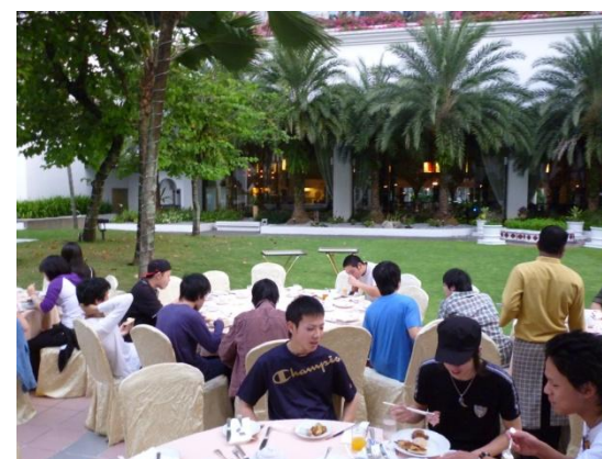
1月17日（火）ホテルの庭での朝食です。