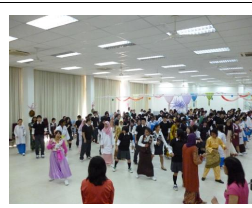
アスンタ高生のリードで「Kuri Kuri」ダンスを教してもらいました。